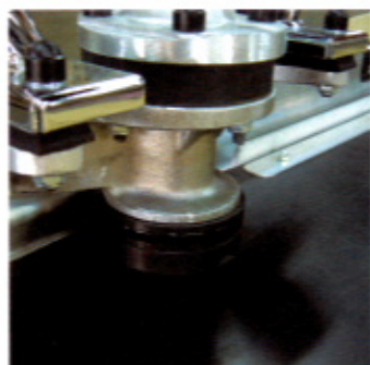
カウンターウエイト