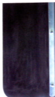
オプションゴムシート